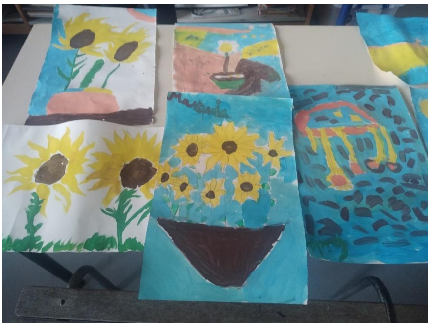
Atelier artistique « les tournesols » de Van GOGH »