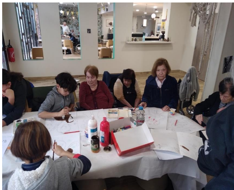
ATELIER ARTISTIQUE INTERGERENATIONNEL